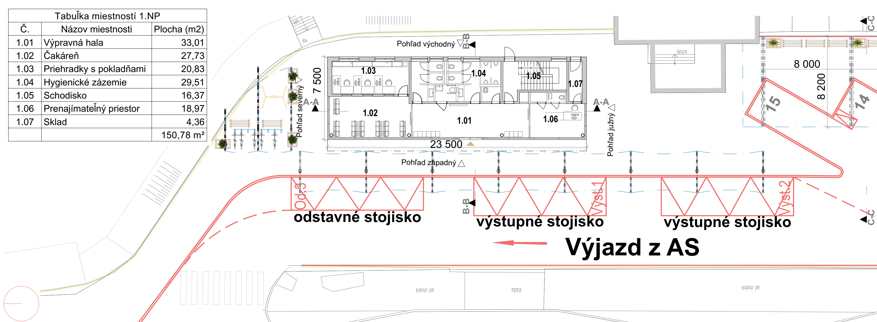
1.4 Pôdorys 1.NP výpravnej budovy M 1:200