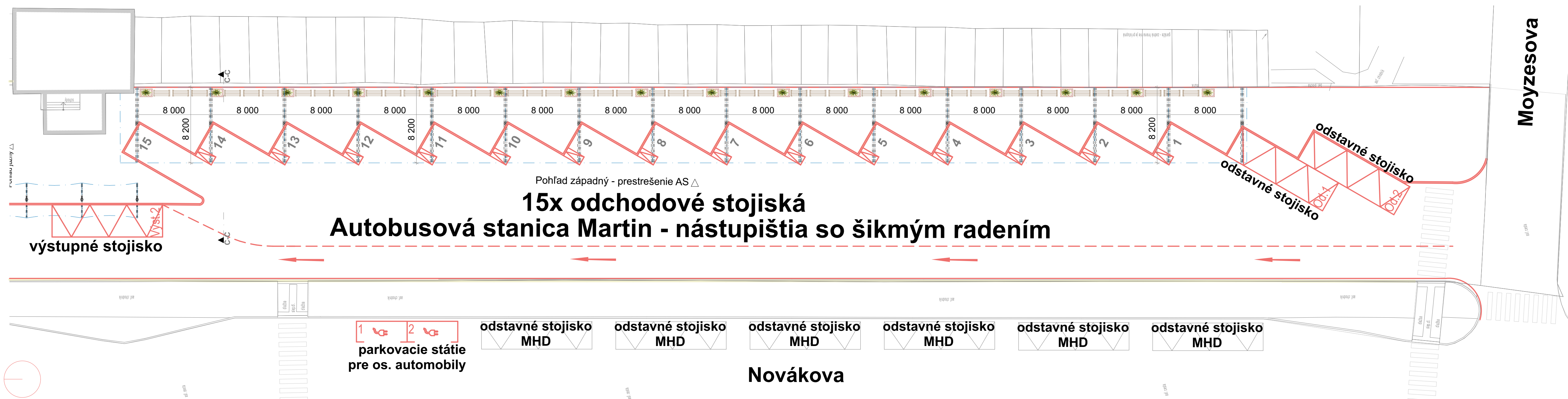
1.3 Pôdorys M 1:250