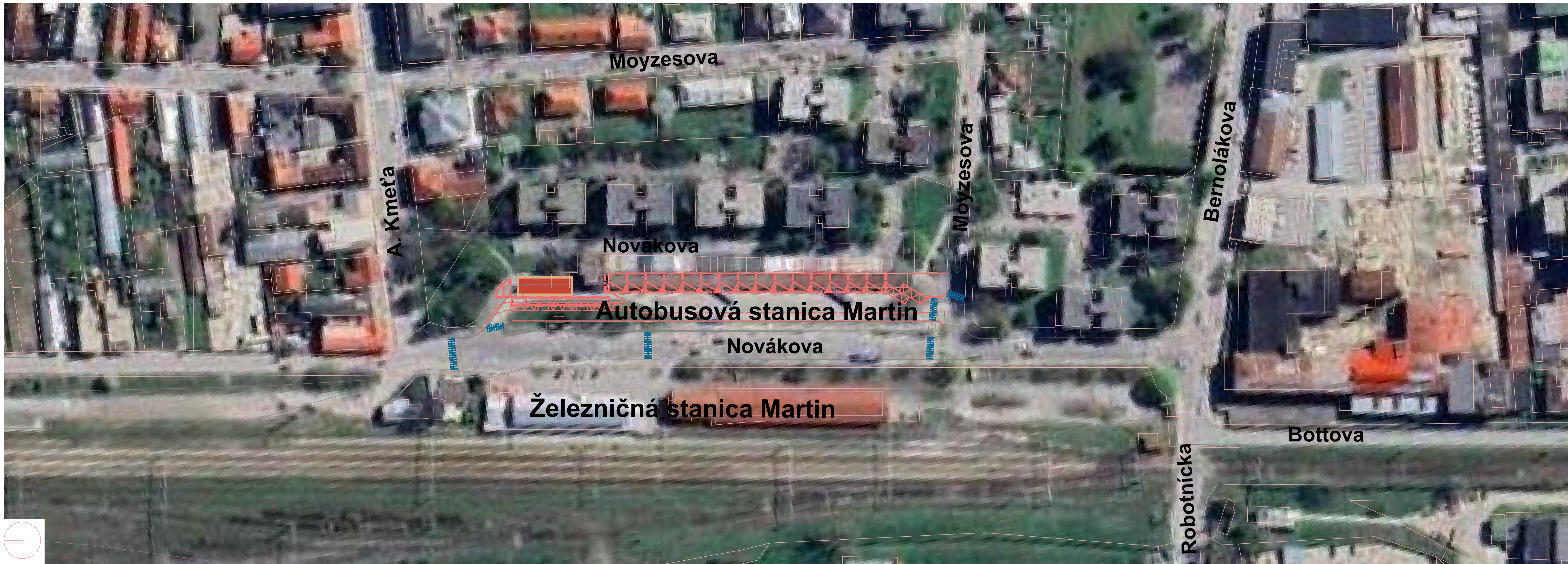
1.1 Situácia širších vzťahov M 1:1000